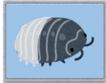
写真①(ひみつ1) 見つけたダンゴムシ (だっぴの仕方)