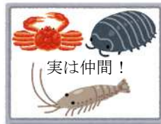
写真③(ひみつ3) ダンゴムシは、 エビやカニの仲間

(1) 発表原こうには、どのような工夫がありますか。1〜4の中から最もふさわしいものを一つ選んで、その番号を書きましょう。 レベル7