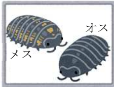
写真②(ひみつ2) オスとメスの ちがい