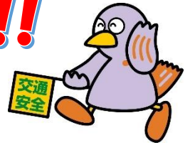
埼玉県マスコット「コバトン」