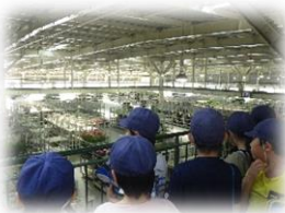
フラワーセンター