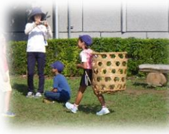
嵐山史跡の博物館